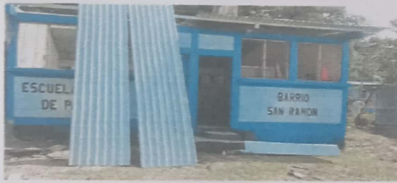
Foto1: SUSTITUCION DE LAMINA POR LAMINA GALVANIZADA